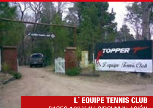
L' EQUIPE TENNIS CLUB PASEO 100 Y AV. CIRCUNVALACIÓN