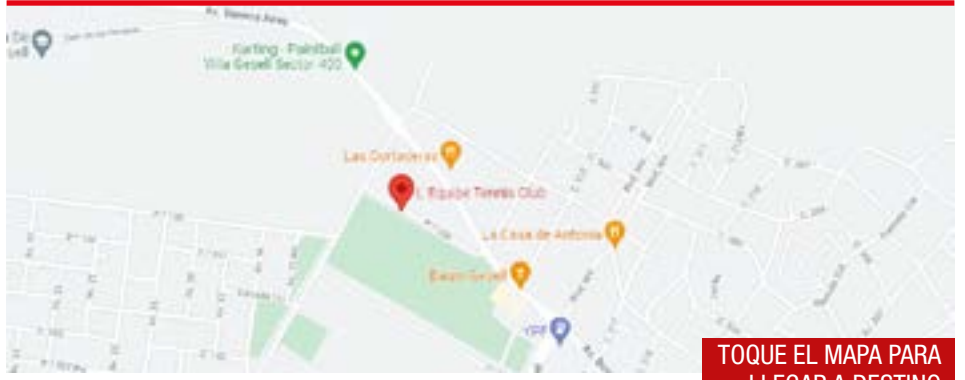
TOQUE EL MAPA PARA LLEGAR A DESTINO