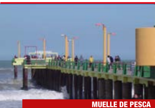
MUELLE DE PESCA VILLA GESELL