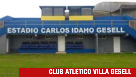
CLUB ATLETICO VILLA GESELL PASEO 112 Y AV. 10