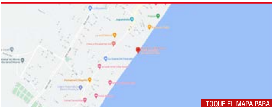
TOQUE EL MAPA PARA LLEGAR A DESTINO

SE COMPITE LUNES 19: COSTA VILLA GESELL / MARTES 20: MUELLE