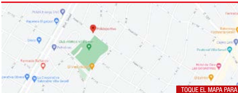
TOQUE EL MAPA PARA LLEGAR A DESTINO

Horarios y días de competencia para TODAS LAS CATEGORÍAS