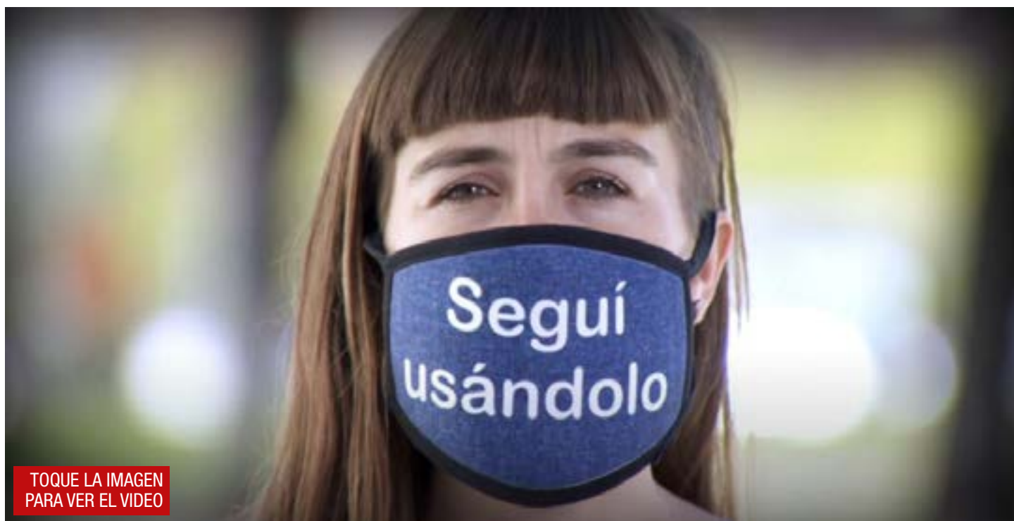
TOQUE LA IMAGEN PARA VER EL VIDEO