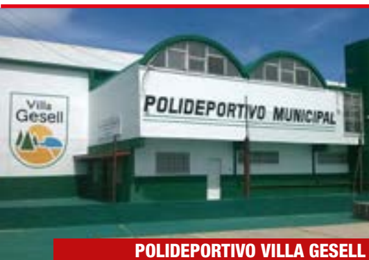
POLIDEPORTIVO VILLA GESELL AVENIDA 10 Y CALLE 110