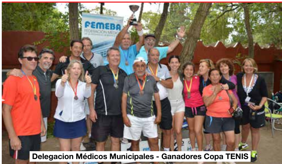
Delegacion Médicos Municipales - Ganadores Copa TENIS